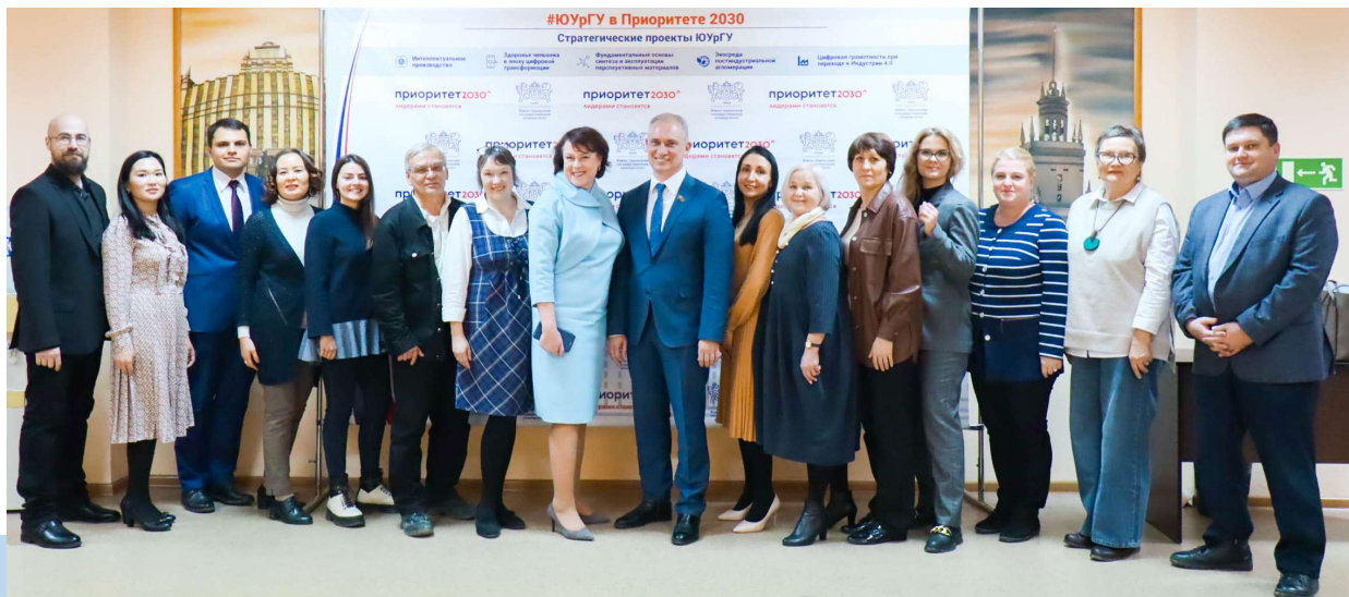
Первая Международная научно-практическая конференция «Государственное и муниципальное управление: вызовы и приоритеты»