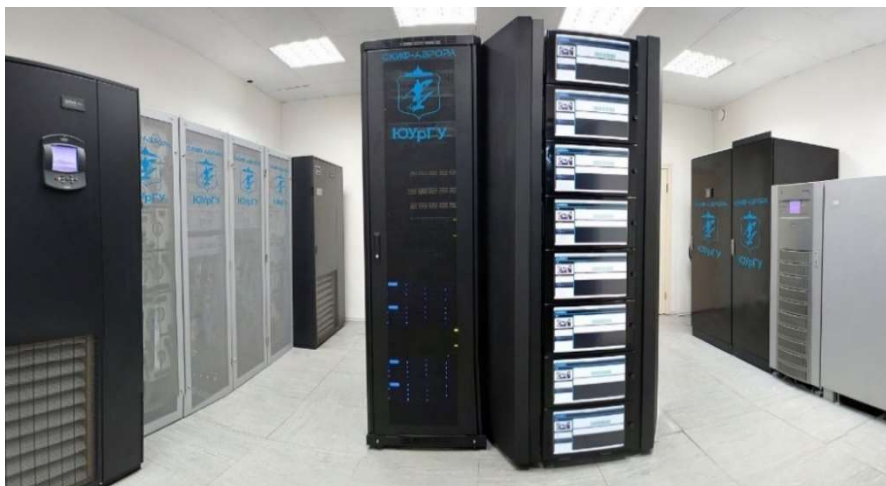
Суперкомпьютер «СКИФ-Аврора ЮУрГУ» (3-е место в ТОП-50 суперкомпьютеров СНГ на момент ввода)

В 2010 г. ЮУрГУ становится одним из 15 вузов России, которые получают статус «Национальный исследовательский университет». С этого момента начинается новый период в развитии ЮУрГУ в более жестких условиях конкурентной борьбы рейтингов, глобализации, открытости образовательного процесса, рыночных отношений в сфере интеллектуальных услуг.