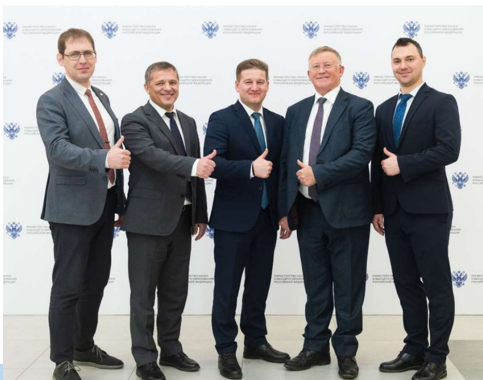
Команда ЮУрГУ на заседании Совета по грантам Минобрнауки РФ

Университет сосредоточился на трех стратегических проектах: «Интеллектуальное производство», «Новые перспективные материалы», «Экосреда постиндустриальной агломерации».