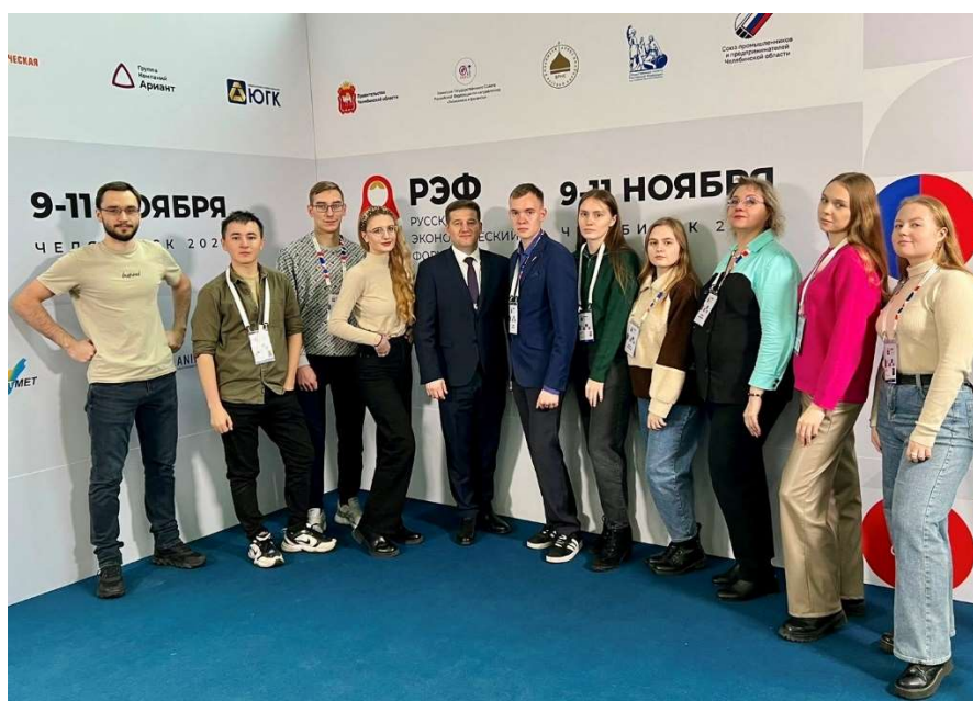
Студенты кафедры ЭТГМУ на Русском экономическом форуме