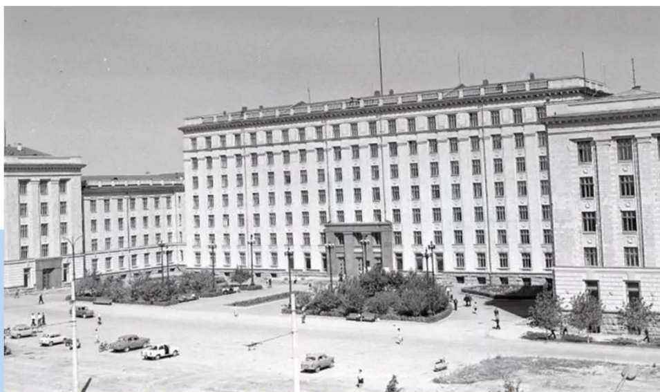
Челябинский политехнический институт имени Ленинского Комсомола, 1970 г.

в настоящее время – кафедра экономики промышленности и управления проектами) и кафедра политической экономии (1952 г., в настоящее время – кафедра экономической теории, региональной экономики, государственного и муниципального управления).